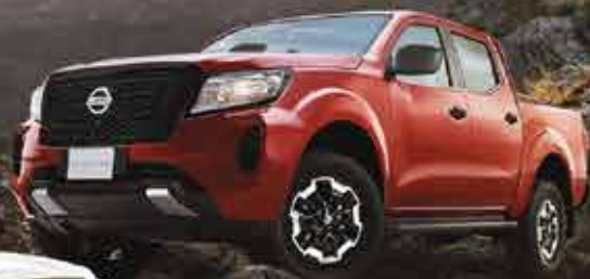
FRONTIER SABANERA 4x2 GASOLINA