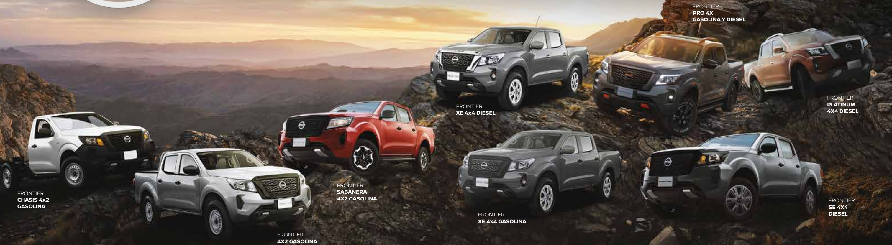
FRONTIER CHASIS 4x2 GASOLINA