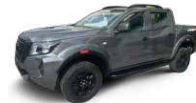
FRONTIER PRO-S 4x2 GASOLINA