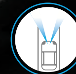
PREVENCIÓN DE CAMBIO DE CARRIL (LDP)*