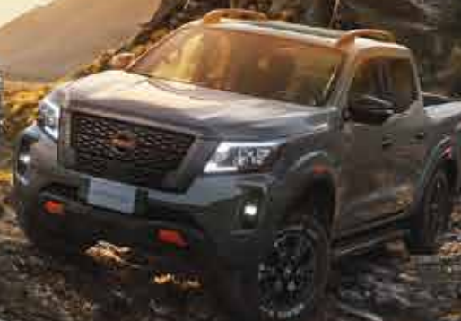
FRONTIER PRO 4x GASOLINA Y DIESEL