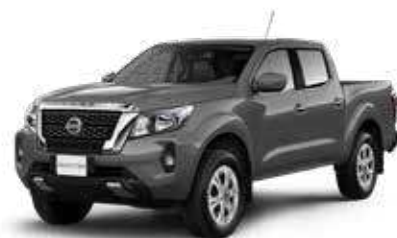
FRONTIER XE 4x4 MT DIESEL