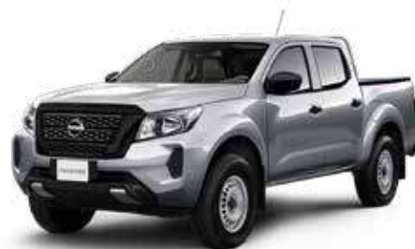
FRONTIER DOBLE CABINA 4x2 GASOLINA