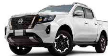
FRONTIER PLATINUM 4x4 MT DIESEL