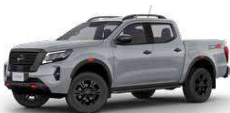
FRONTIER PRO-4X 4x4 AT DIESEL