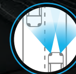
ASISTENTE DE LUZ ALTA (HBA)*