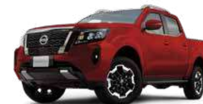
FRONTIER PLATINUM 4x4 AT DIESEL