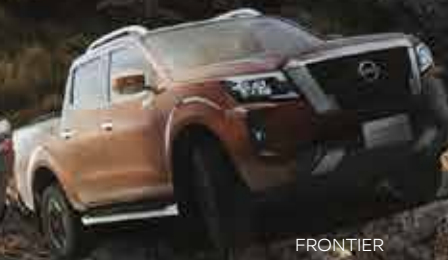
FRONTIER PLATINUM 4x4 DIESEL