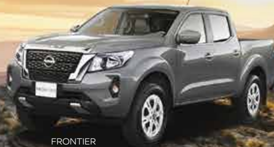
FRONTIER XE 4x4 DIESEL