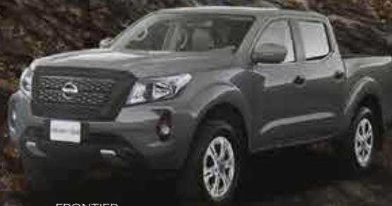
FRONTIER XE 4x4 GASOLINA