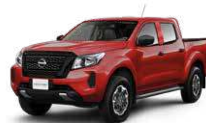
FRONTIER SABANERA 4x2 GASOLINA