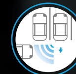
ALERTA DE TRÁFICO CRUZADO EN REVERSA (RCTA)*