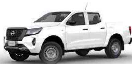
FRONTIER S 4X4 AT DIESEL