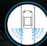
ALERTA DE PUNTO CIEGO (BSW) E INTERVENCIÓN DE PUNTO CIEGO (BSI)*