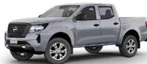
FRONTIER SE 4X4 MT DIESEL