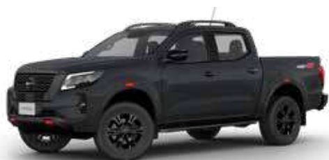
FRONTIER PRO-4X 4x4 AT GASOLINA