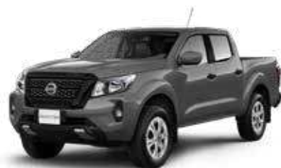
FRONTIER XE 4x4 AT GASOLINA

LA FAMILIA Y EL TRABAJO PUEDEN COMPARTIR LA MISMA AVENTURA.