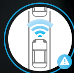
ASISTENTE DE FRENADO INTELIGENTE DE EMERGENCIA (IEB)*