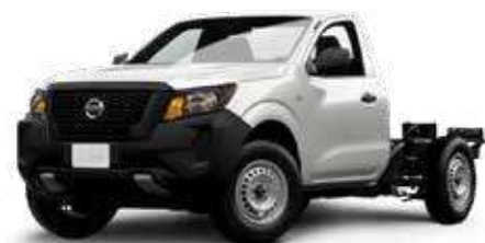
FRONTIER CHASIS 4x2 GASOLINA