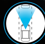
ALERTA DE COLISIÓN FRONTAL (I-FCW)*