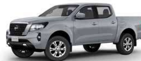
FRONTIER XE 4x4 AT DIESEL