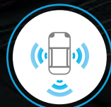
MONITOR DE VISIÓN PERIFÉRICA TODO TERRENO PARA 4X4 (4 CÁMARAS) + DETECTOR DE OBJETOS EN MOVIMIENTO (I-VM)*