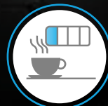
ALERTA DE ATENCIÓN AL CONDUCTOR (DAA)*