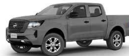
FRONTIER SE 4X4 AT DIESEL