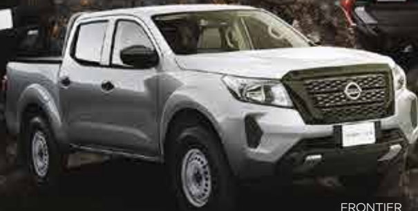
FRONTIER 4x2 GASOLINA