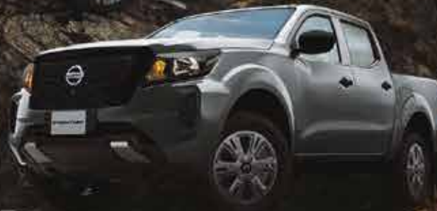
FRONTIER SE 4x4 DIESEL